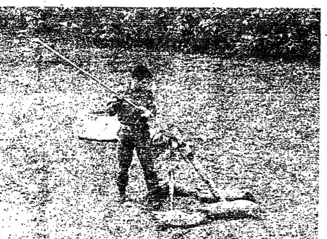
اصبح للسراني امس ، مدمج مارون بعبدا ، وقد ركز في بلمتصا ووجه للاستخدام عند الحاجة . مصور الانوار ، رافق العميلة في سلسلة تقاطع في اعلا وعلى المنعقدة .